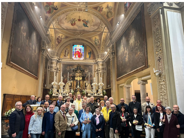
FOTO ANNIVERSARI DI MATRIMONIO